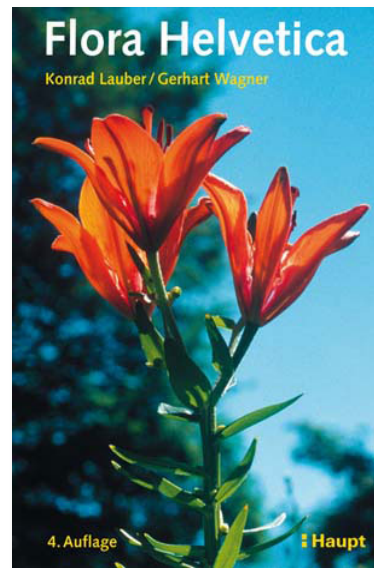
4. Auflage 2007