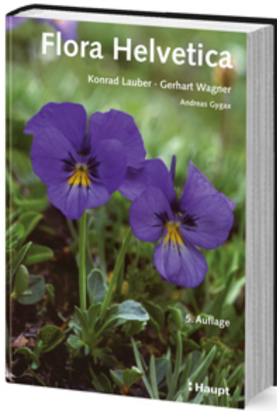
5. Auflage 2012