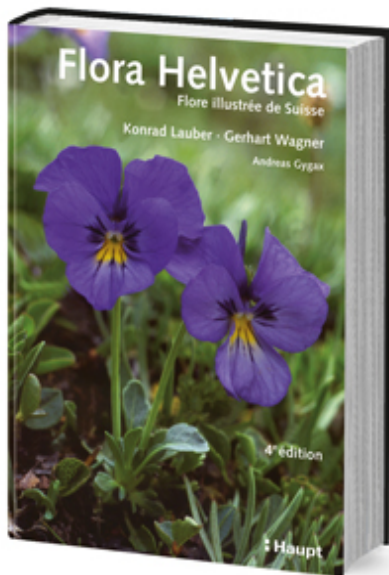
4 e édition 2012